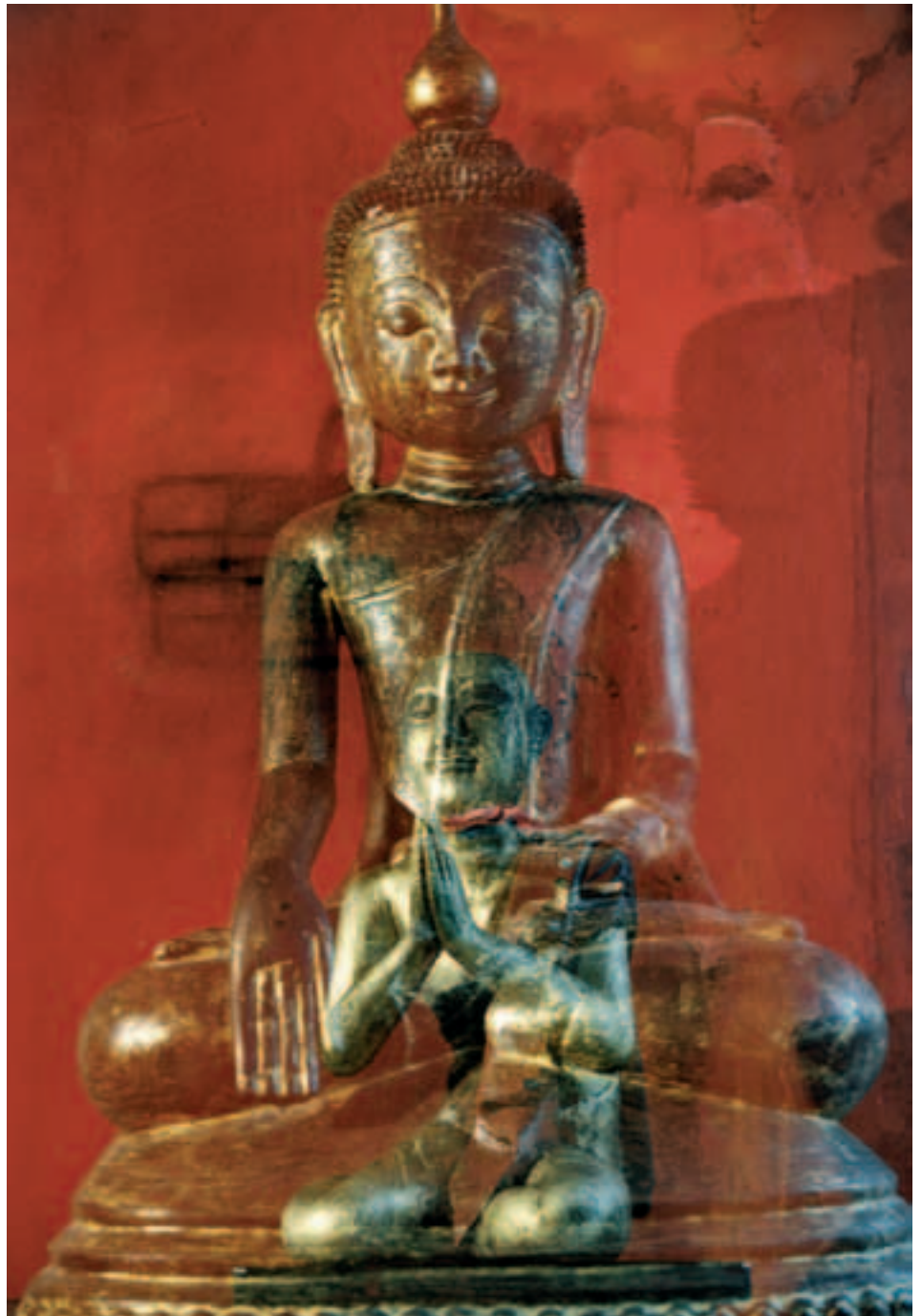
Buddha und Mönch

Mit der Ausstellung „Symbol & Vision“ hat Uschi Rodenstock gleich in zweifacher Hinsicht einen großen Beitrag geleistet: Durch die Spenden für die Finanzierung der Vision des Hauses lebensmut und durch die visionäre Auseinandersetzung