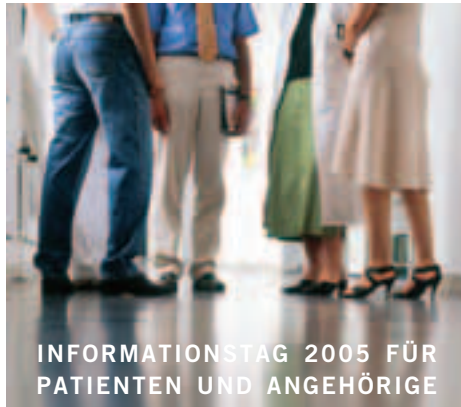
INFORMATIONSTAG 2005 FÜR PATIENTEN UND ANGEHÖRIGE

Es ist nahe liegend und doch kann man es nicht oft genug aussprechen. Lebensmut macht den Menschen wirklich Mut. Wer am 17. September in Großhadern dabei war, der konnte viele Gesprächsfetzen erhaschen und Momente beobachten, in denen dieses hoffnungsvolle Gemeinsam-